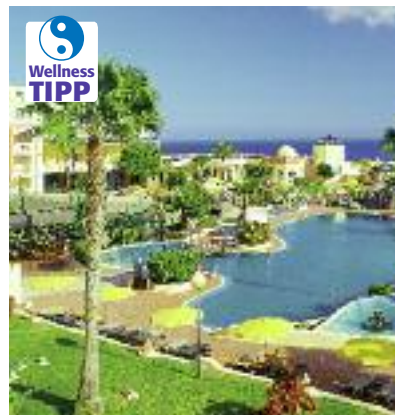
Kanarische Inseln & Kapverden SO 2014 S. 74 Code: FOLA 22322 A 25 HP/AI

Preis p. P. DZ/HP 2 Wo. ab 1.070 € 1 Wo. ab 735 €