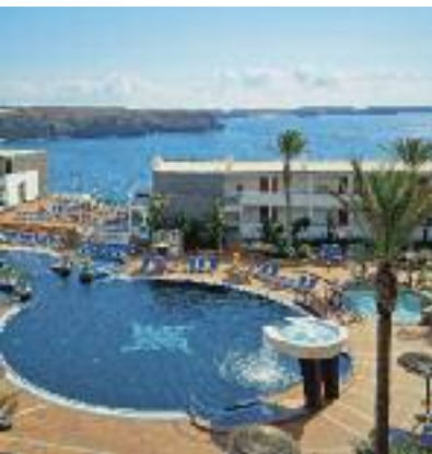
Kanarische Inseln & Kapverden SO 2014 S. 158 Code: FOLA 20125 A 2A HP/AI

Preis p. P. DZ/HP 2 Wo. ab 949 € 1 Wo. ab 579 €