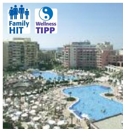
Südeuropa & Nordafrika SO 2014 Seite 267 Code: FOLA 42755 A 2A HP

Preis p. P. DZ/AI 2 Wo. ab 1.569 € 1 Wo. ab 879 €