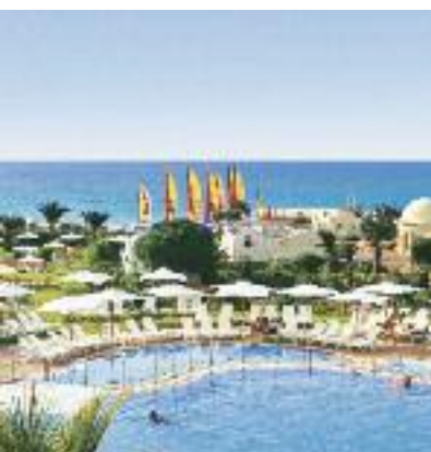
ALDIANA SO 2014 ab Seite 108 Code: FOLA 55210 X 2A AI

Preis p. P. DZ/AI 2 Wo. ab 1.579 € 1 Wo. ab 859 €