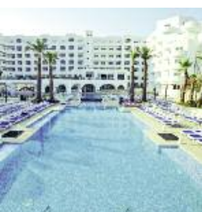
Südeuropa & Nordafrika SO 2014 Seite 318 Code: FOLA 48135 A 2A FR/HP/AI

Preis p. P. DZ/HP 2 Wo. ab 1.008 € 1 Wo. ab 629 €