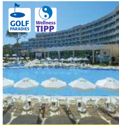
Südeuropa & Nordafrika SO 2014 Seite 39 Code: FOLA 79193 A 2A AI

Preis p. P. DZ/AI 2 Wo. ab 1.209 € 1 Wo. ab 699 €