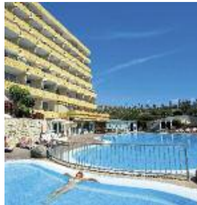
Kanarische Inseln & Kapverden SO 2014 S. 109 Code: FOLA 15505 A 2A HP/VP/AI

Preis p. P. DZ/HP 2 Wo. ab 910 € 1 Wo. ab 678 €