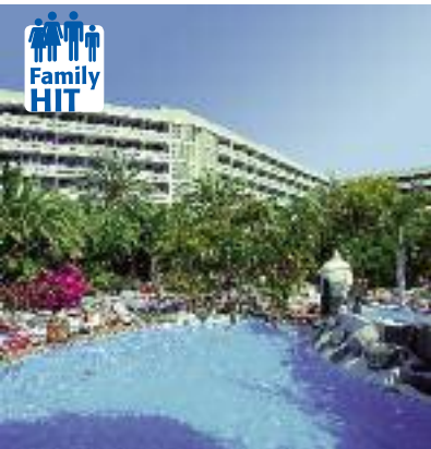
Kanarische Inseln & Kapverden SO 2014 S. 33 Code: FOLA 13615 A 2A HP/AI