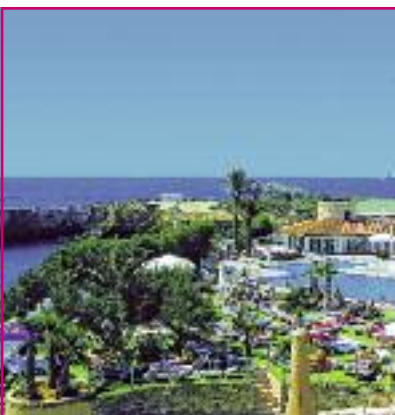
Preisknüller Sonne & Meer SO 2014 Seite 93 Code: FOLA 19922 A 2A HP/AI

Preis p. P. DZ/HP 2 Wo. ab 1.111 € 1 Wo. ab 787 €