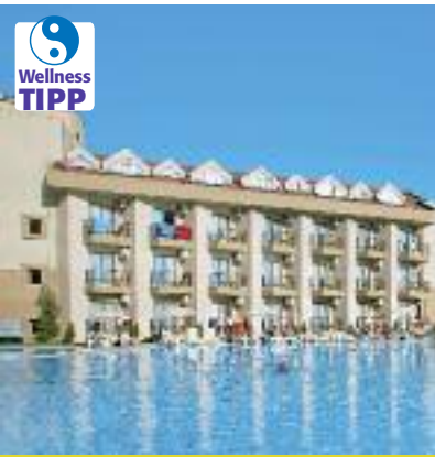
Südeuropa & Nordafrika SO 2014 Seite 51 Code: FOLA 40821 A 2A AI

Preis p. P. DZ/HP 2 Wo. ab 1.270 € 1 Wo. ab 846 €