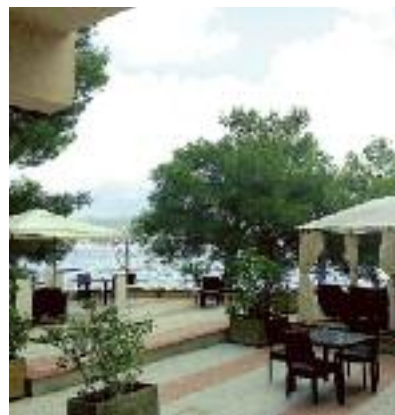
Spanien & Portugal SO 2014 Seite 118 Code: FOLA 19349 A 2A HP

Preis p. P. DZ/HP 2 Wo. ab 914 € 1 Wo. ab 549 €