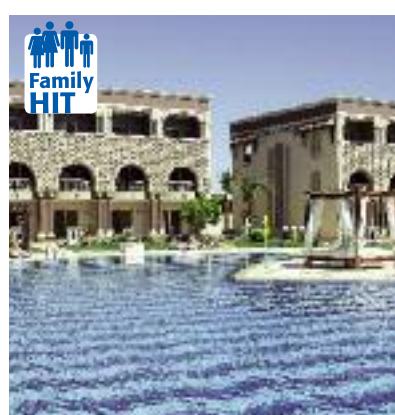
Südeuropa & Nordafrika SO 2014 Seite 146/147 Code: FOLA 38560 A 25 AI

Preis p. P. DZ/FR 2 Wo. ab 899 € 1 Wo. ab 595 €